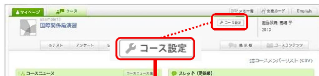
コースストップ画面

「コースメンバー（担当教員・履修生）も表示」をクリックすると、担当教員や履修生の登録メンバーも確認することができます。