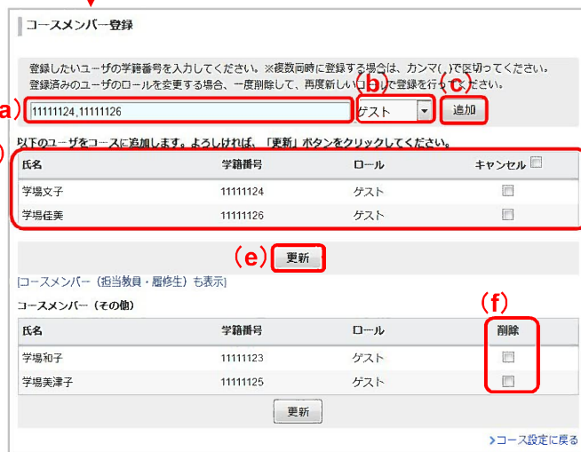
コースメンバー登録画面